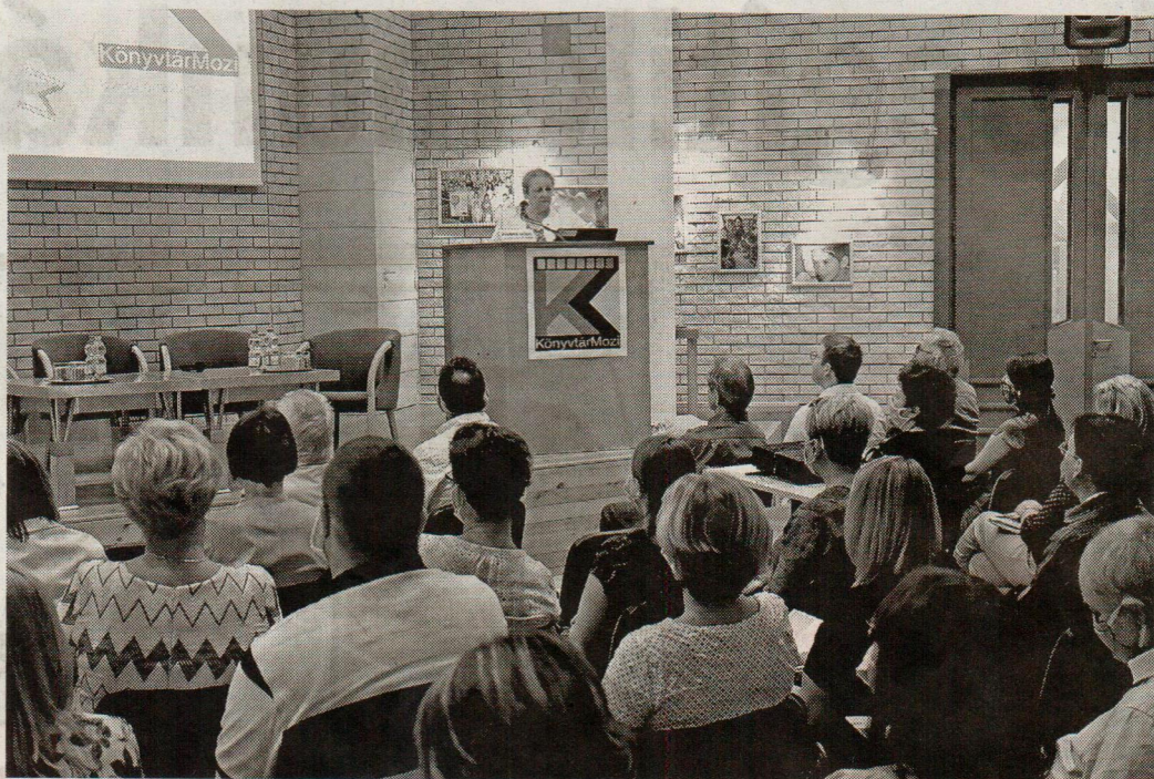
A szakmai napnak a Bács-Kiskun Megyei Katona József Könyvtár adott otthont tegnap

Elmondta: a KönyvtárMozi programról először 2015 júniusában egy konferencián beszéltek, majd ősszel, október 5-én kezdődött el. Az első vetítés október 6-án történt meg Dunafalván. Az együttműködő partnerek szinte a kezdetektől állandóak. A technikai háttér kialakítását a Nemzeti Kulturális Alap biztosította, a tartalmi munkában közreműködik a Magyar Művészeti Akadémia, a vetítések a Nemzeti Audiovizuális Archívum által valósulnak meg.